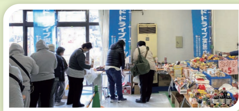
困窮者支援としてフードドライブ事業など