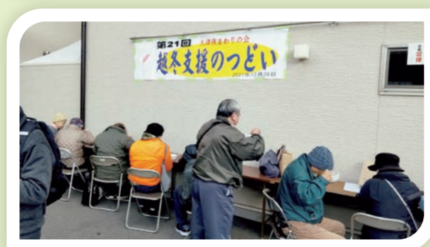
歳末時期の越冬支援活動など