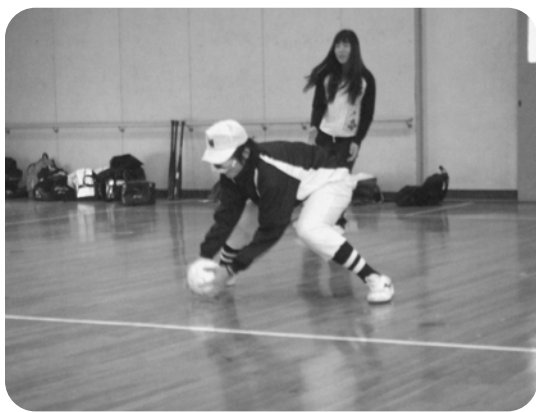
▲全盲のシュミレーションレンズをかけ、ノックされたボールを取る様子＝県立盲学校で

当初は試合形式が予定されていたものの、残念ながらこの日はあいにくの雨模様となり、県立盲学校の小体育館での体験となりましたが、全盲、白濁、視野狭窄の3種類のシュミレーションレンズ(※説明は下欄)を使ってバッティングから守備、走塁など、さまざまなことを体験されました。