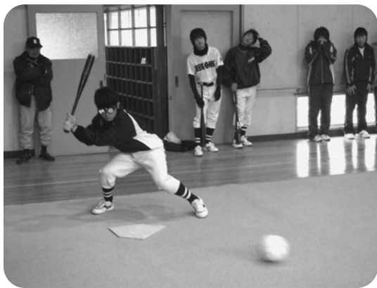
▲全盲のシュミレーションレンズをかけ、ボールの転がる音を頼りにバッティング

交流を通じ、「違い」を感じるだけでなく、「一緒にできることは何か。」ということを考えていました。