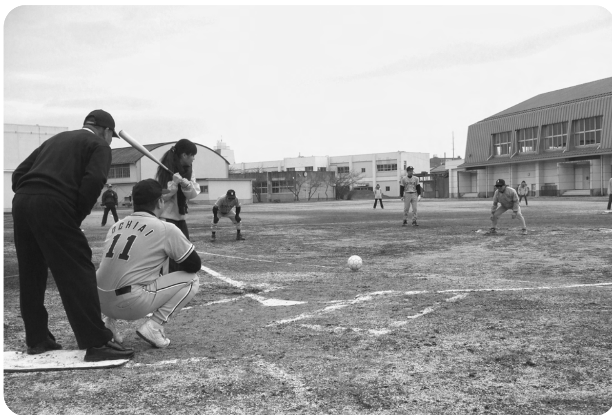
▲転がされたボールを打つ参加者。ピッチャーは「アイシェード（目隠し）」を付けてボールを転がしています。

この広報紙の一部は、赤い羽根共同募金の 配分金やみなさまからの会費で作成してい ます。