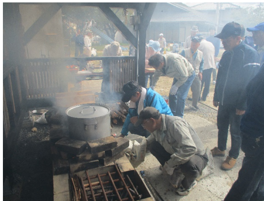
炊き出しの真っ最中です！！