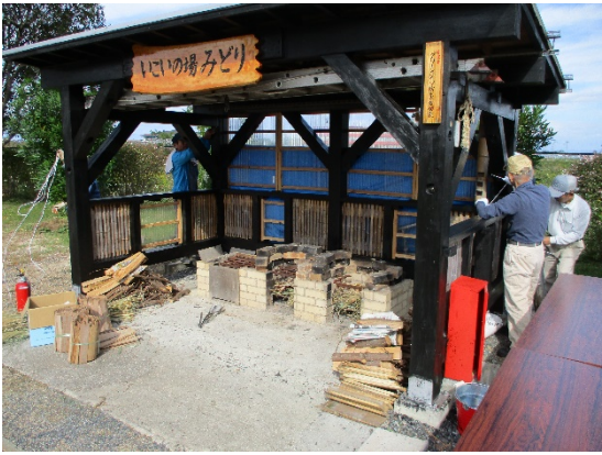
かまどベンチに火をつける前に風除けシートを張る