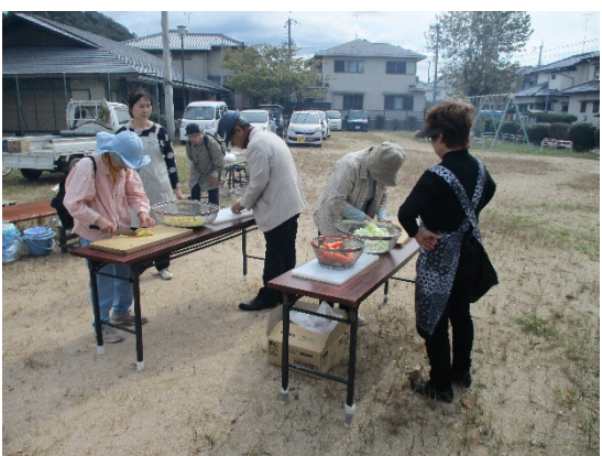
受講者も野菜切りにチャレンジ②