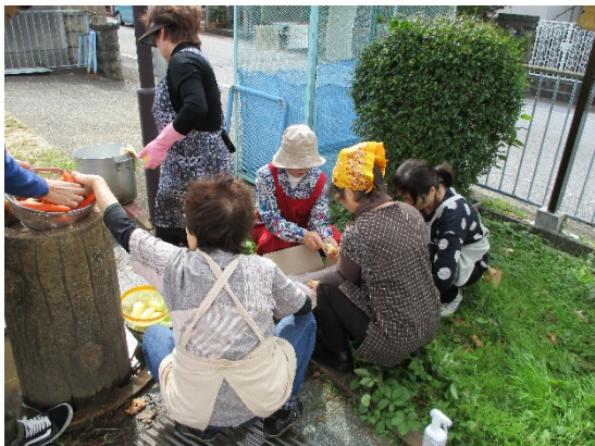
カレーに欠かせない野菜を洗う