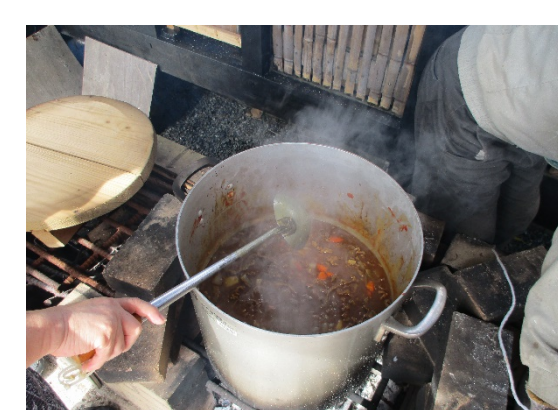
かまどベンチを使って炊き出したカレーがそろそろ出来上がるころです。