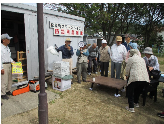
カレーが出来上がるまでの時間を活用し、自主防災会のみなさんが「簡易トイレ」「給水袋」などの説明をしてくださいました。