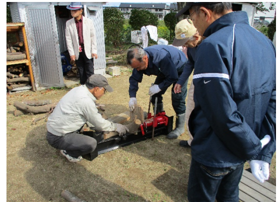
薪割り機を使って焚き木をつくる