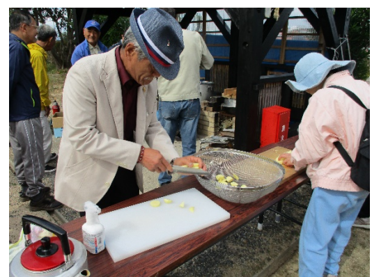
受講者も野菜切りにチャレンジ①