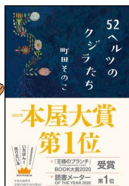
52 ヘルツのクジラたち 町田そのこ