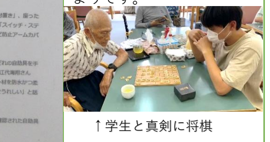
↑学生と真剣に将棋