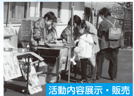
活動内容展示・販売