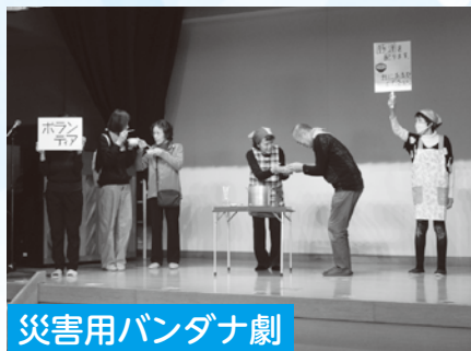
災害用バンダナ劇