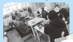
▲ボランティアグループ「なないろ」による軽作業