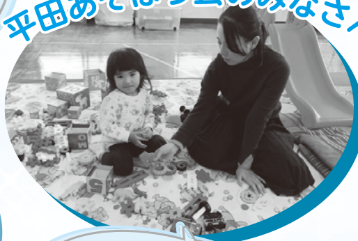
平田あそぼう会のみなさん

さりげなく子どもを見守ってくれてありがとうございます。安心してパパやママとお喋りできます。