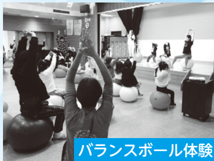
バランスボール体験