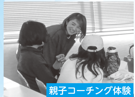
親子コーチング体験