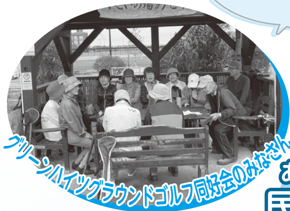
グリーンハイツグラウンドゴルフ同好会のみなさん

高齢化のなか、一番近くで相談できる人が民生委員さん。訪問活動をしてくれるので、相談窓口として活躍してほしい。そこに、自治会もできることを協力していきたいです。